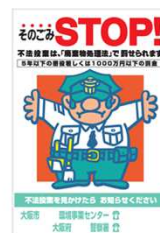
「環境」 不法投棄防止の看板寄贈