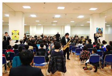
「文化」 大阪府下の児童養護施設・ファミリーホーム の子どもたちを招待してコンサートを開催 協力:OsakaShinonWindOrchestra