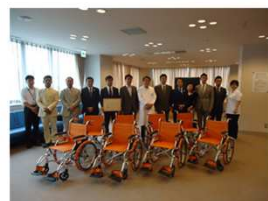
「医療」車いすの寄贈