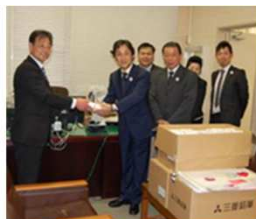
「教育」小学生へ鉛筆の寄贈